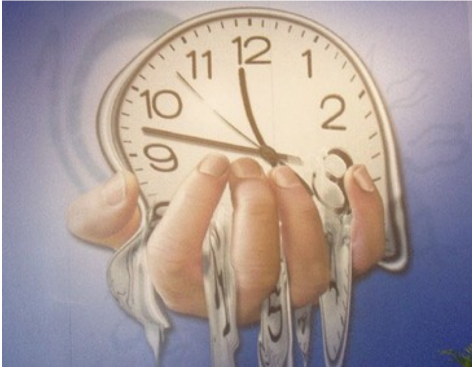
„Die weiche, fließende Uhr“ inspiriert von Salvador Dalí: „Die weiche Uhr - die zerfließende Zeit.“